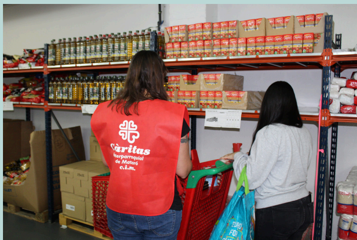
Voluntària acompanyant a una usuària per la botiga de l'Entorn

Els canvis en la política d'adjudicació de recursos per a la distribució d'aliments a la població desafavorida, per part de la Unió Europea, provoca inquietud i molts dubtes.